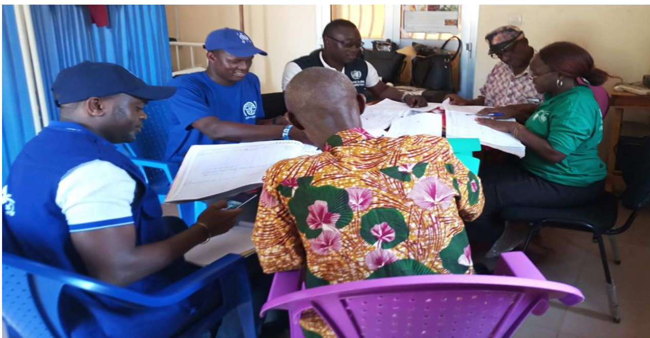
Figure 2 : Revue Documentaire à l'hôpital préfectoral de Kissidougou