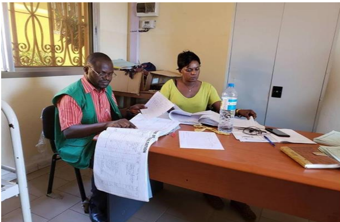
Figure 1 : Revue Documentaire à l'hôpital régional de Mamou